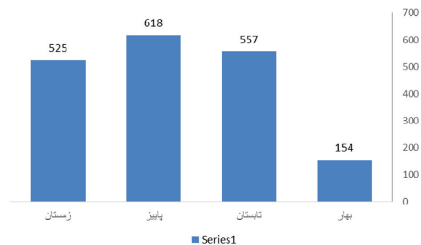
نمودار ۲- تغییرات موارد بیماری لیشمانیوز جلدی در شهرستان خاتم بر حسب فصل طی سال ۹۲-۱۳۸۳

در مطالعه‌ی حاضر از نظر فصل انتشار بیماری، بیشترین موارد در فصل پاییز و کمترین موارد بیماری در فصل بهار گزارش گردید و همچنین پیک بیماری در آبان ماه رخ داد (نمودار ۲).